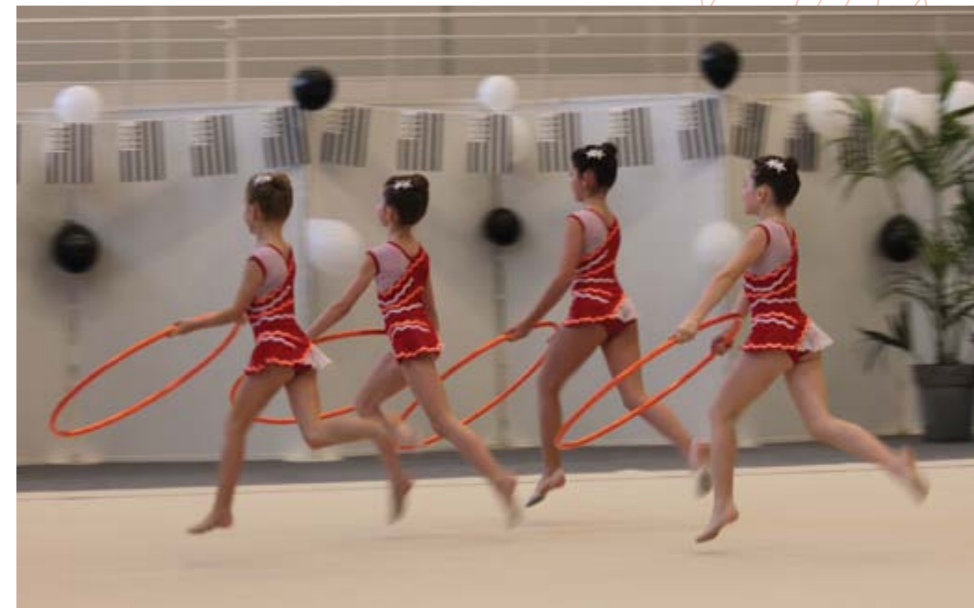
Les Championnats de Bretagne de gymnastique rythmique "ensemble" se sont déroulés à Rennes les 16 et 17 mars derniers. Une occasion pour les jeunes gymnastes du Cercle Paul Bert de se qualifier pour la finale de zone.

Plus d'informations : www.rennes-monostars.durab.fr